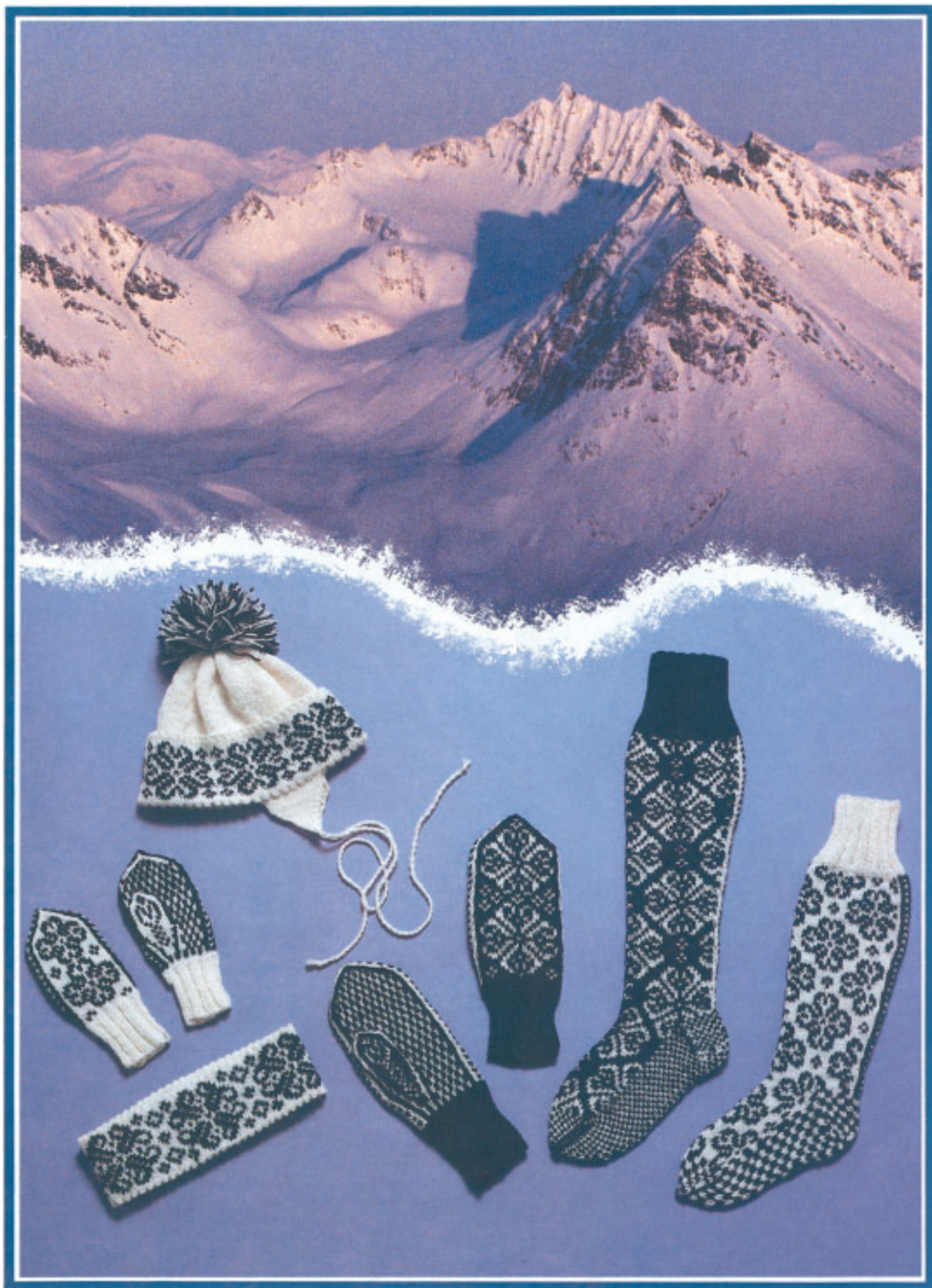
Votter, strømper, luer, pannebånd. Rauma 3 tr. Strikkegarn. Fargealt. 3 Størr.: 3-5, 7-9, 11-14 år, dame, herre