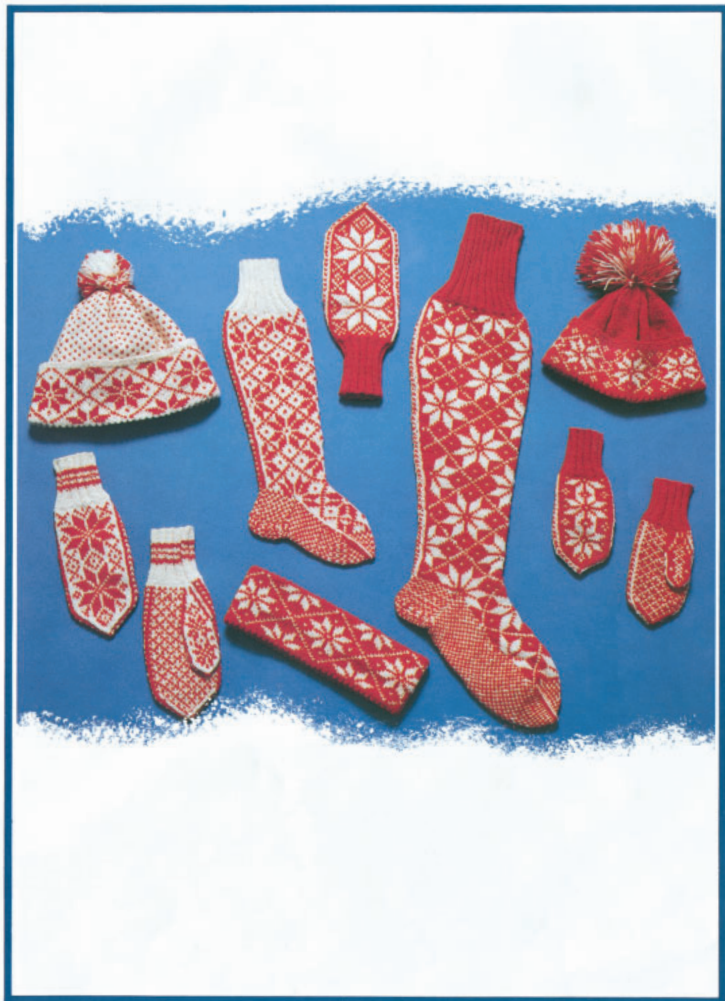
Votter, strømper, luer, pannebånd. Rauma 3 tr. Strikkegarn. Fargealt. 2 Størr.: 3-5, 7-9, 11-14 år, dame, herre