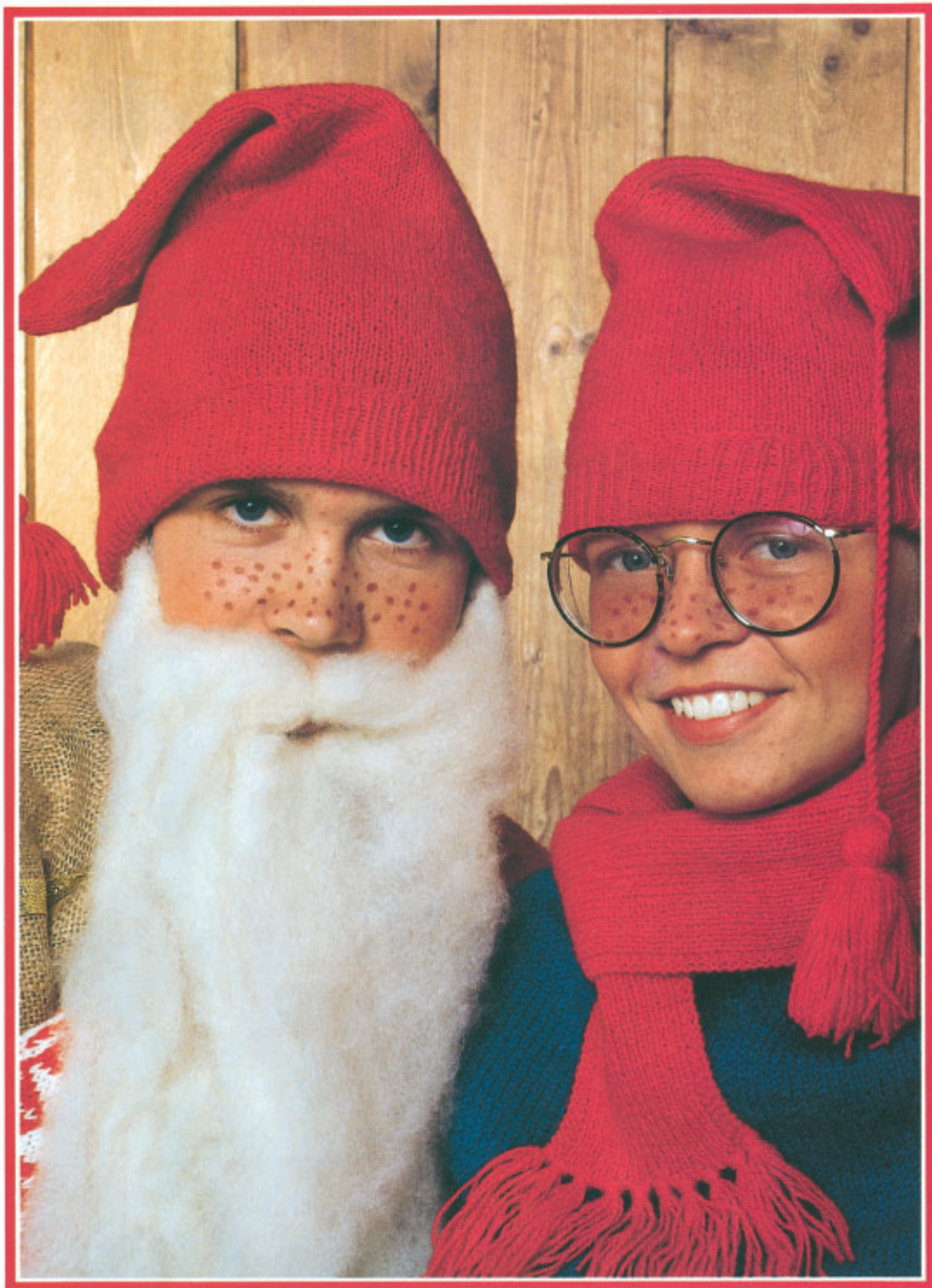
Nisseluer og skjerf. Rauma Finullgarn. Størr.: 3-5, 7-9 år, dame, herre