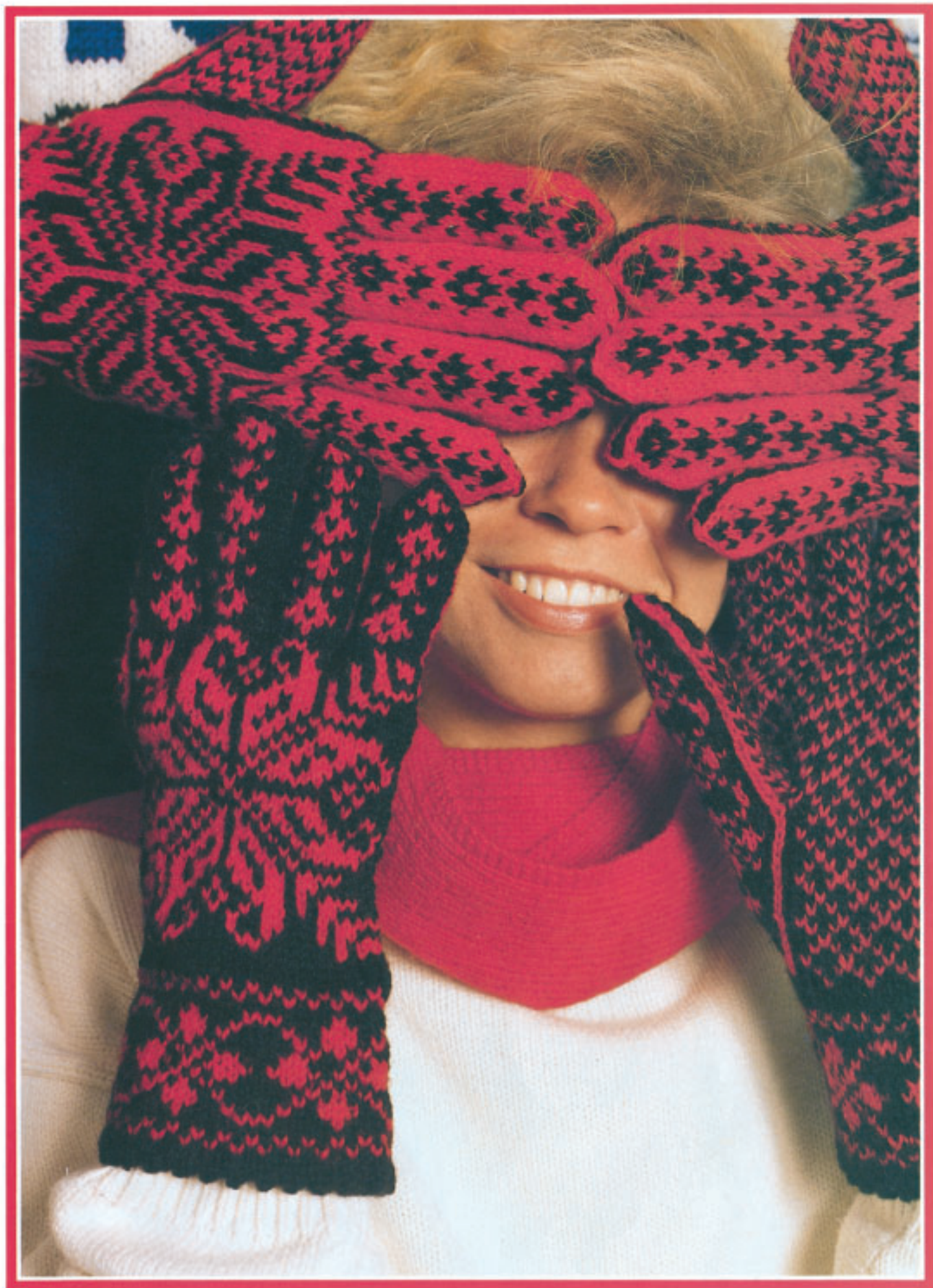
Vanter. Rauma Finullgarn. Størr.: dame, herre