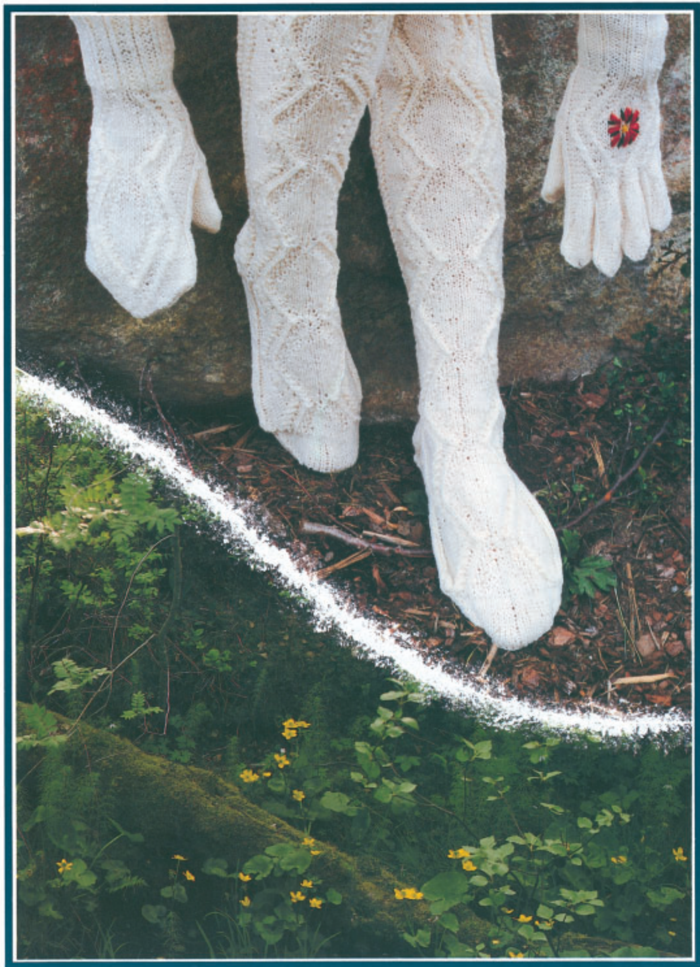
Votter, strømper, vanter. Rauma 3 tr. Strikkegarn. Størr.: dame, herre